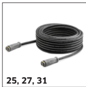
25, 27, 31